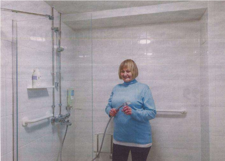
Kuva toteutetusta suihkutilasta.