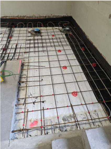
Kuvia työmaalta.

Muutostyöt sujuivat hyvässä yhteistyössä käyttäjän kanssa, vaikka Paavalinkirkko oli koko muutostyön ajan normaalissa käytössä. Urakoitsijalla oli käytössä viikkotiedote, jota jaettiin sähköpostitse erillisen jakelulistan mukaan. Hanke toteutettiin aikataulussa ja sille varatussa kustannuspuitteessa. Suoritukseen ollaan tyytyväisiä.