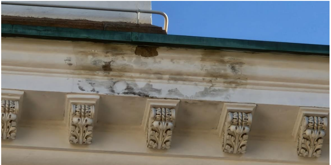
11. Paikallinen vaurio räystäslistassa (todennäköisesti pieni reikä jalkarännissä/räystäspellissä)