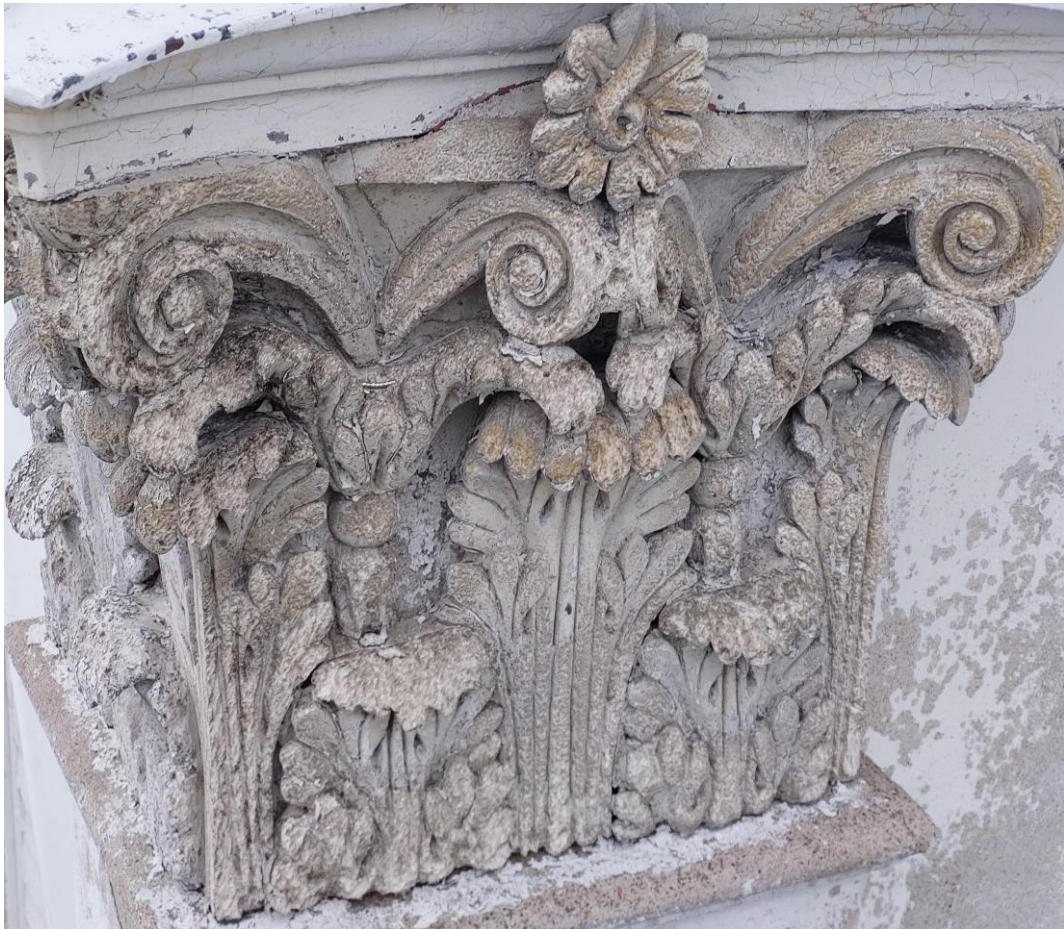
8.Vuonna 1998 remontissa korjattu kapiteelin koriste

Tuomiokirkon julkisivujen korjattavuusselvitys 2023