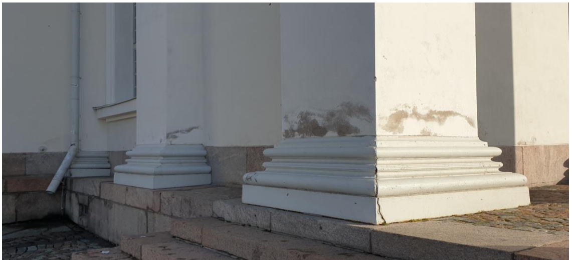
13. Maalivaurioita pilasterien alapäissä (tyyppiongelman)

Tuomiokirkon julkisivujen korjattavuusselvitys 2023