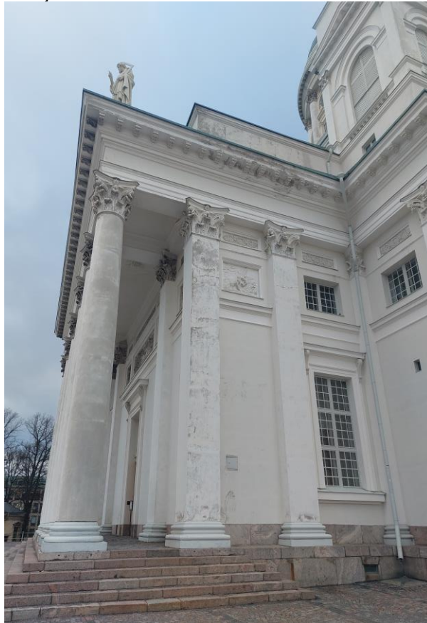
6. Korjausaluetta vuodelta 2016