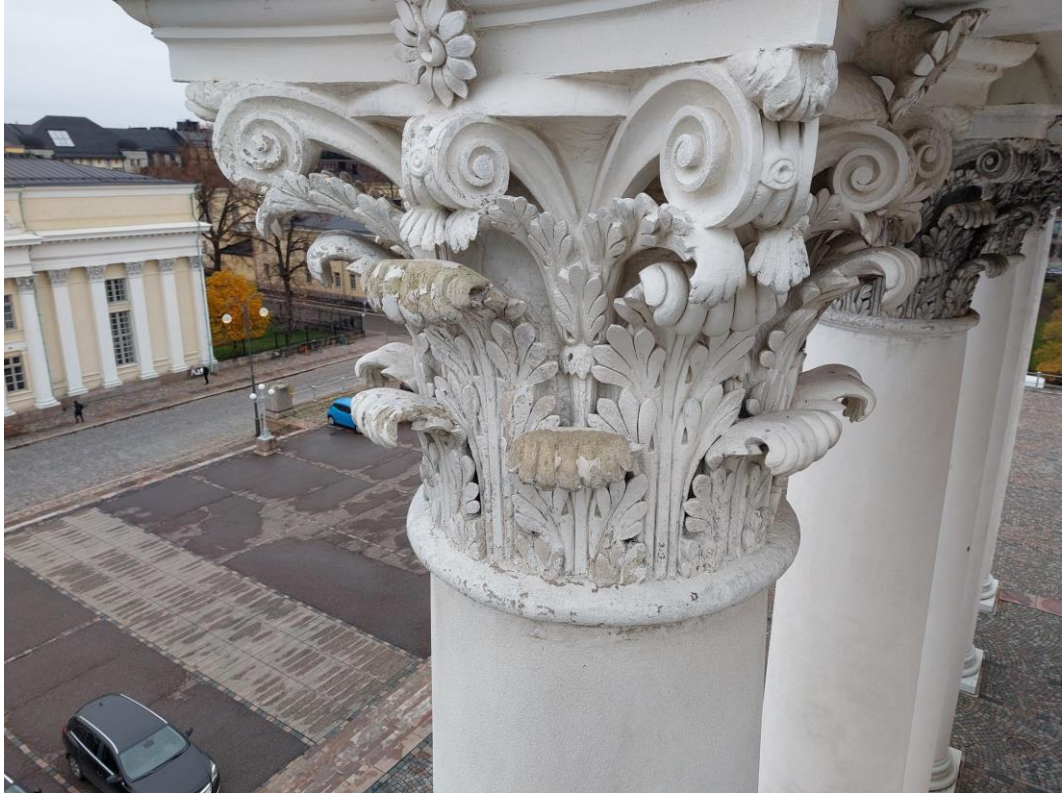
7.Vuonna 2016 korjattu pylvään kapiteelin koriste