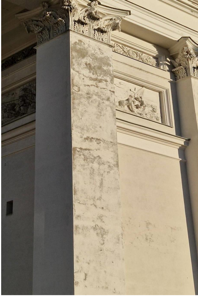
9. Vuonna 2016 korjatuilla alueilla maalipinnan kulumista nurkkapilasterissa