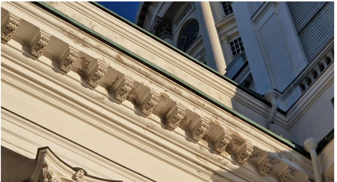
10. Vuonna 2016 korjattua räystäslistaa