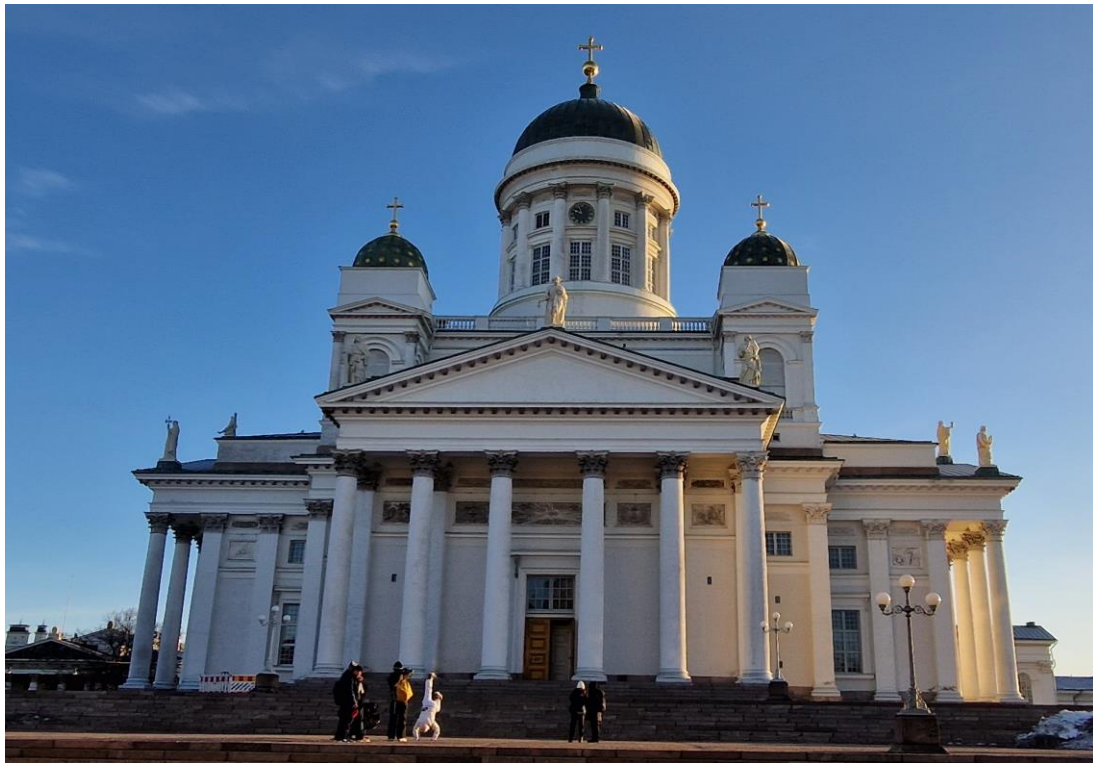
kuva tammikuu 2023