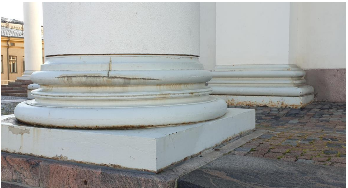
12. Halkeama pylväiden alapään teräsosassa ja ruostevaurioita