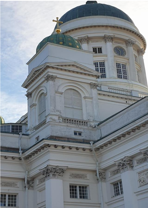
1. Yleiskuvia maalipintojen kulumisesta eri puolilla kirkkoa