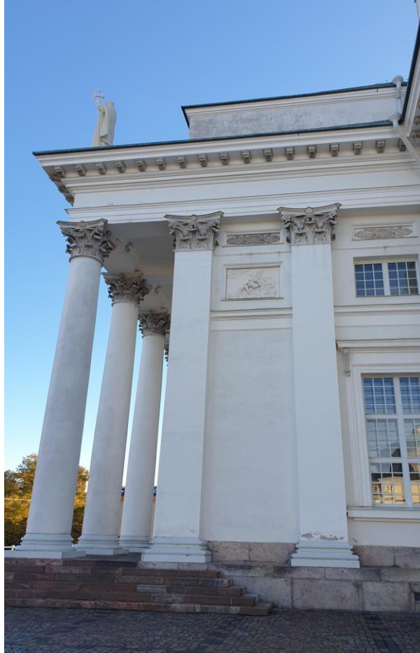
5. Korjausaluetta vuodelta 2015